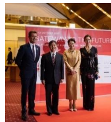
皇太子ご夫妻とデンマーク皇太子夫妻