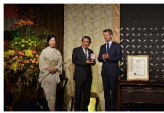
フレデリック皇太子より瓦葺会長に栄誉のメダルを授与