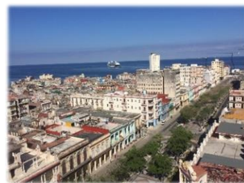
ハバナ市中心部の街並み