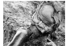
発見時のグラウベールマン