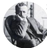
ヴィルヘルム・ハマスホイ Vilhelm Hammershøi 1864年5月15日 - 1916年2月13日